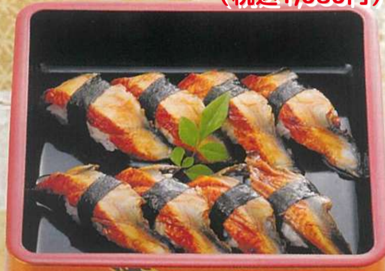
11 うなぎにぎり 1,650円 (税込1,780円)