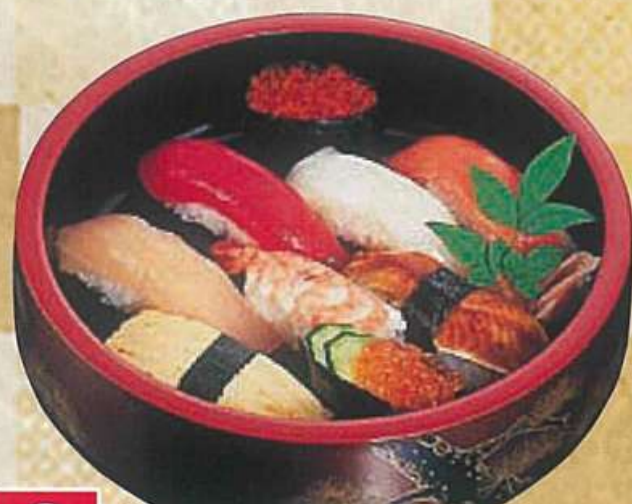
2 秀っ子 1,200円 (税込1,296円)