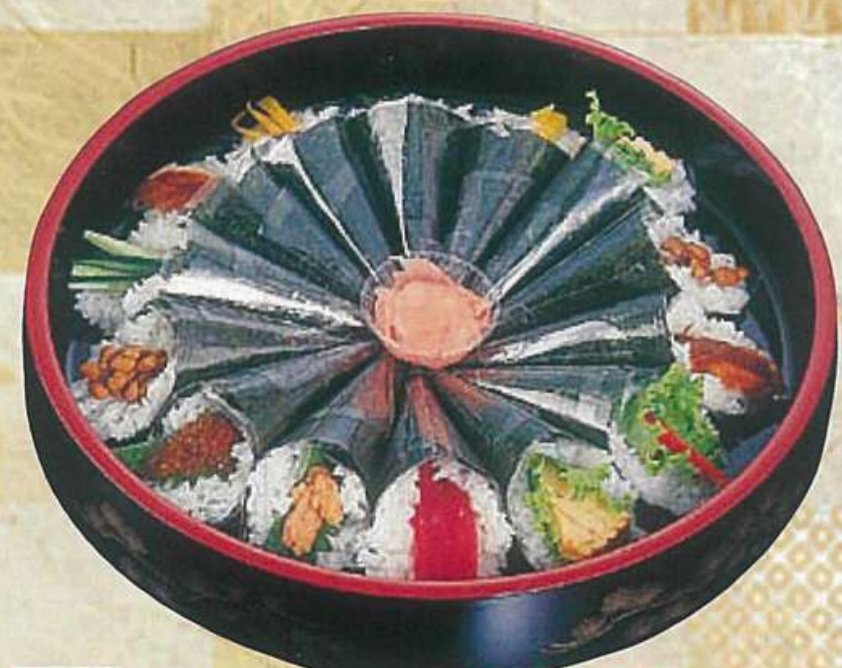
18 手巻盛合せ (14本) 3,600円 (税込3,888円)