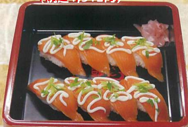
9 サーモンマヨにぎり 1,000円 (税込1,080円)