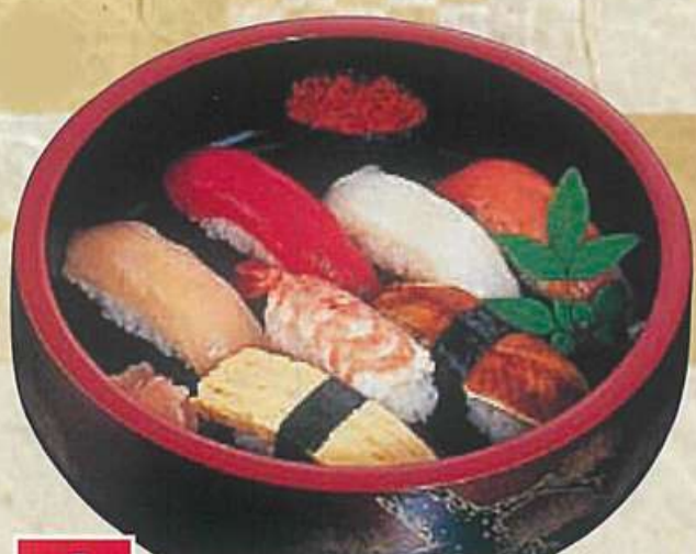
1 江戸前にぎり 1,000円 (税込1,080円)