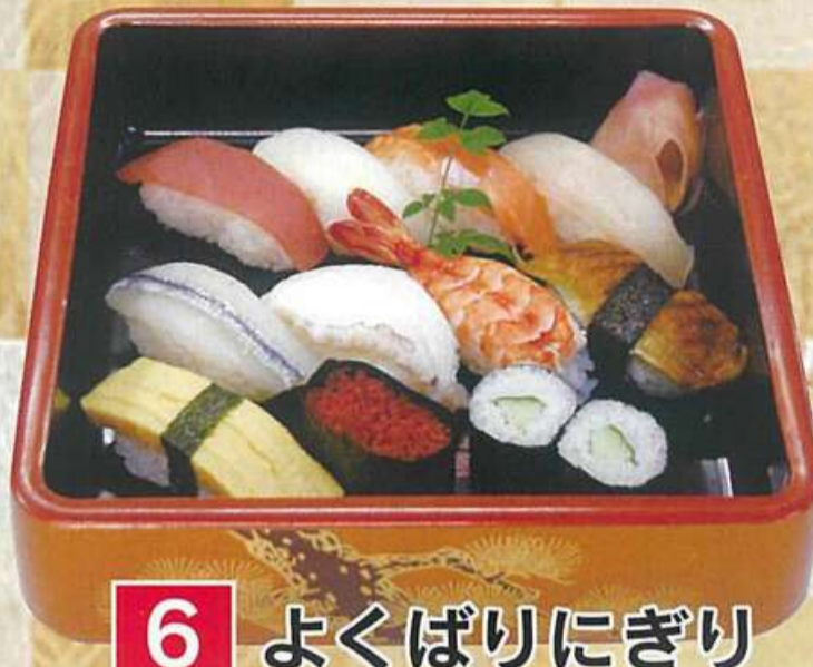
6 よくばりにぎり 1,400円 (税込1,512円)