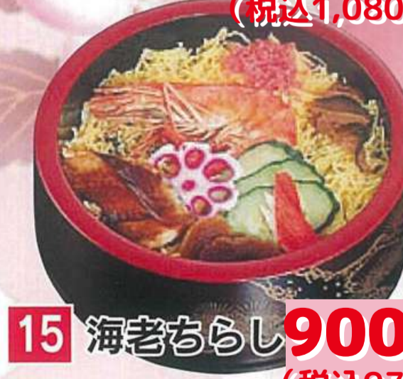
15 海老ちらし 900円 (税込972円)