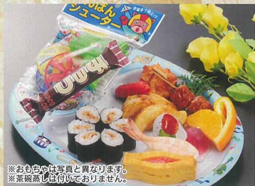
17 お子様寿司 900円 (税込970円)