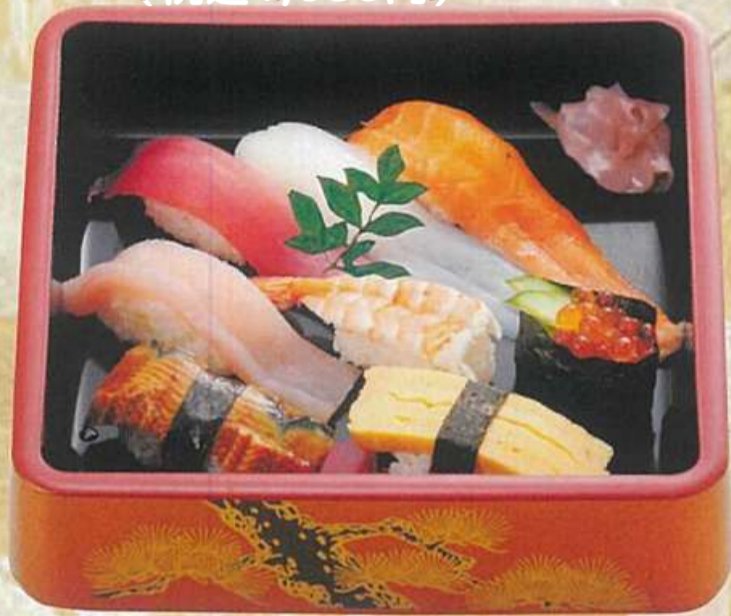
5 中にぎり 1,500円 (税込1,620円)