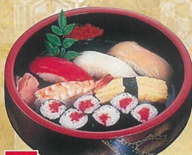
3 にぎり鉄火 1,000円 (税込1,080円)