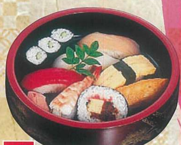
4 にぎり盛合せ 950円 (税込1,026円)