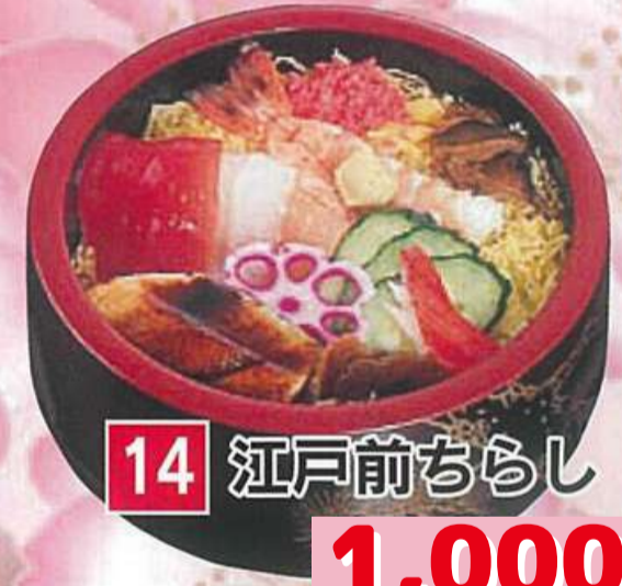
14 江戸前ちらし 1,000円 (税込1,080円)