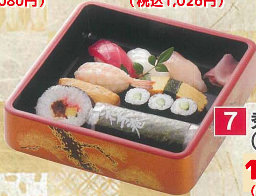
7 秀盛合せ (手巻入) 1,100円 (税込1,188円)