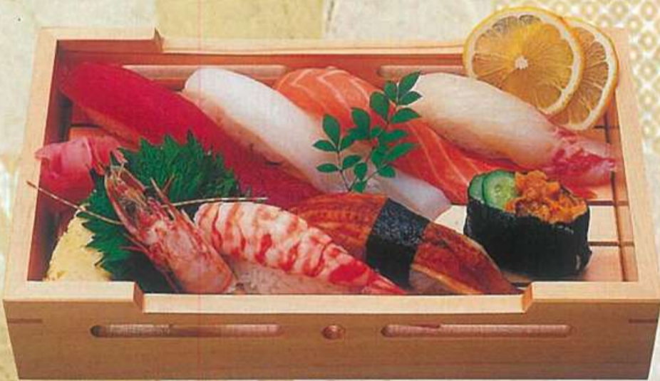
8 上にぎり 1,800円 (税込1,944円)